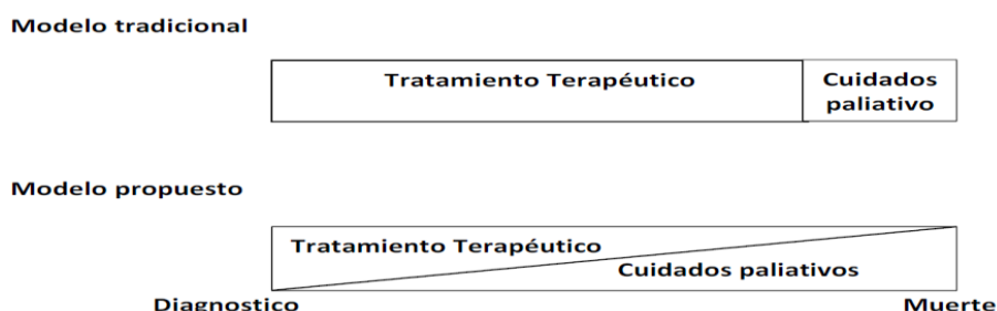
FIG. 1: Modelos de atención paliativa